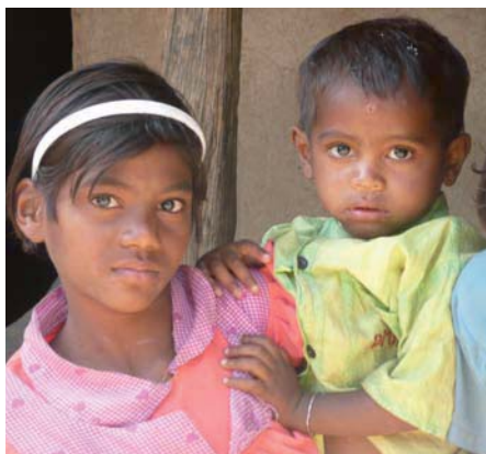
Kinder fördern-Zukunft schenken