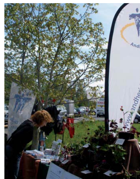
Andheri-Hilfe vertreten bei der Solarkochschule in Rheinbach

Andheri-Hilfe ist Mitglied bei VENRO und beim Deutschen Paritätischen Wohlfahrtsverband.