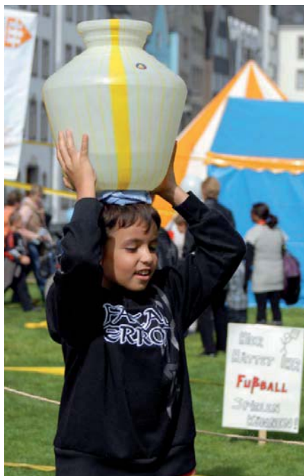
Indischen Kinderalltag erleben beim Weltkindertag in Köln 2010

Zunahme der Internetbesuche im Zeitraum 2008 bis 2010 (s. Diagramm) ist auch auf die zahlreichen Verlinkungen unserer Webseite mit vielen privaten und gewerblichen Nutzern des Internets zurückzuführen.