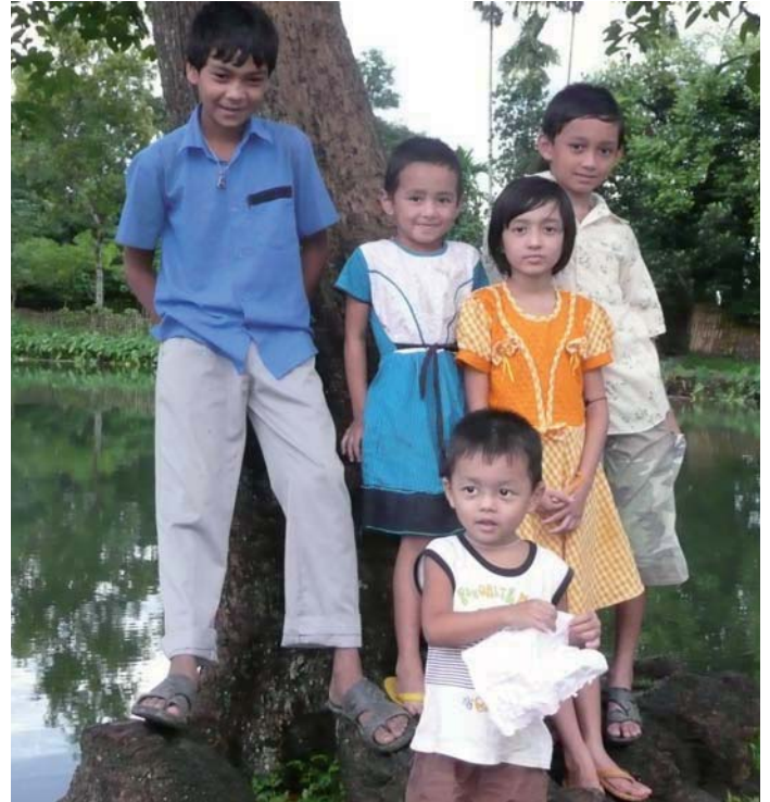
Prävention ist eine ganz wichtige Aufgabe, um diesen Kindern ihr Augenlicht zu bewahren.

Eine weitere Veränderung fand im Bereich der Eye-Camps statt: Sofern die Orte nicht zu weit entlegen sind, finden jetzt sog. Screening-Camps statt: Patienten werden untersucht und behandelt. All diejenigen, die operiert werden sollen, werden in das nächstgelegene Augenhospital gebracht, wo die Operationsmöglichkeiten weit besser sind als im Camp. Außerdem können die Ärzte so mehr Patienten auch in den Hospitälern versorgen.